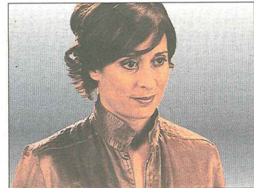
Fotograma de La nit de l'orgasme .

El sexe sempre ven. Juntament amb els concursos, suposa un dels dos eixos vertebrals de la programació televisiva, segons un estudi, presentat aquesta setmana, sobre les tendències televisives a la majoria dels països del món per a la temporada 2007-2008. Sincerament, les anàlisis dels experts no fan més que confirmar el que tots podem veure amb una simple passejada per les graelles. Pel que fa als programes monogràfics, van perdent gràcia a mesura que decreix l'originalitat. A l'autonòmica catalana no han inventat la sopa d'all, està clar. Però benvingudes siguin les propostes de divulgació sexual quan deixen de banda la morbositat i contribueixen a parlar amb naturalitat d'un